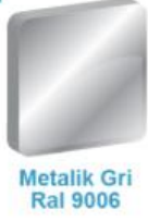
Metalik Gri Ral 9006